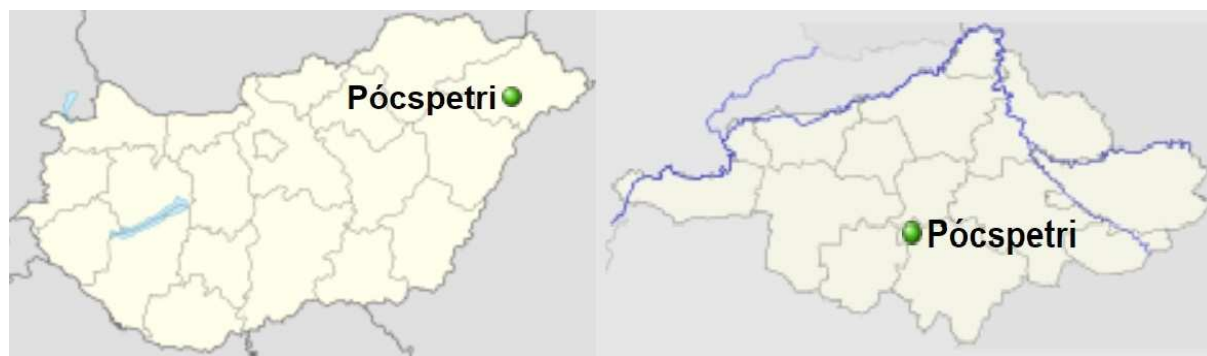
Pócspetri Község pozíciója Magyarország és Szabolcs-Szatmár-Bereg megye térképén 2

Teljes területe 26,37 km 2 , a belterület ebből 2,24 km 2 . A lakások száma 639, míg egyéb lakóegységek száma nincs nyilvántartva. Pócspetri Község állandó népessége 2019-es KSH adatok alapján 1630 fő, míg népsűrűsége 64 fő/km 2 . 1