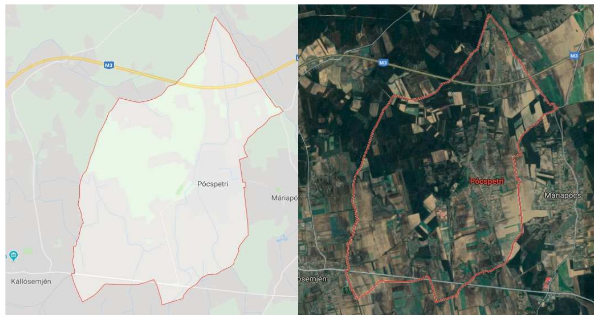
Átnézeti térkép teljes közigazgatási terület 3